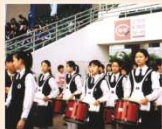
調理課外活動之一：敲擊步操隊

課外活動專為同學而設，同學就是「用家」。調理中學的課外活動五花八門，同學對參與這些活動有何看法呢？記者和一位中四的同學談過這個問題，以下是談話的摘錄：